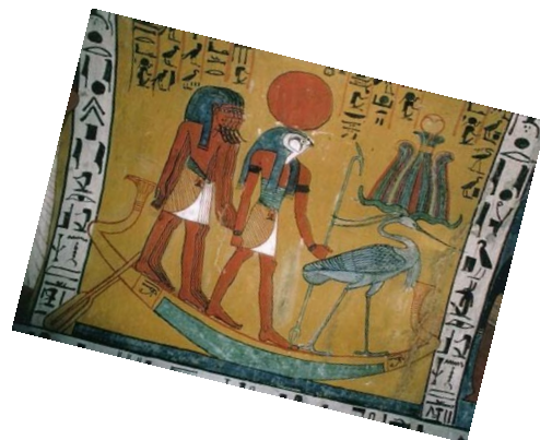
Ra, Dios sol