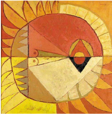
El sol – Oswaldo Guayasamín