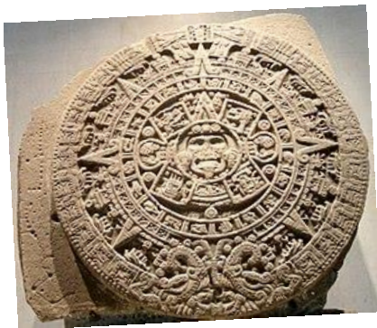
Piedra del Sol (Calendario Azteca)

En esta oportunidad les invito a reflexionar sobre un amigo muuuy importante y antiguo que tiene la humanidad: EL SOL. ¿Y porqué será tan importante para nosotros? El Sol ha sido fuente de inspiración para los humanos en diferentes civilizaciones y épocas, contándonos de su importancia para sus vidas.