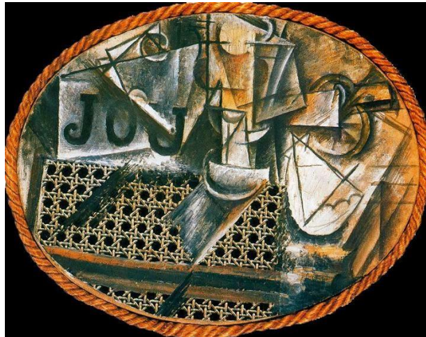
“Naturaleza muerta con silla de rejilla” de Pablo Picasso

Entre algunos de los artistas más conocidos por su incursión en el collage tenemos a: Marcel Duchamp, Max Ernst, Kazimir Malevich, Henri Matisse, Pablo Picasso, Robert Pollard, Man Ray, Larry Rivers, Antonio Berni y muchos más.