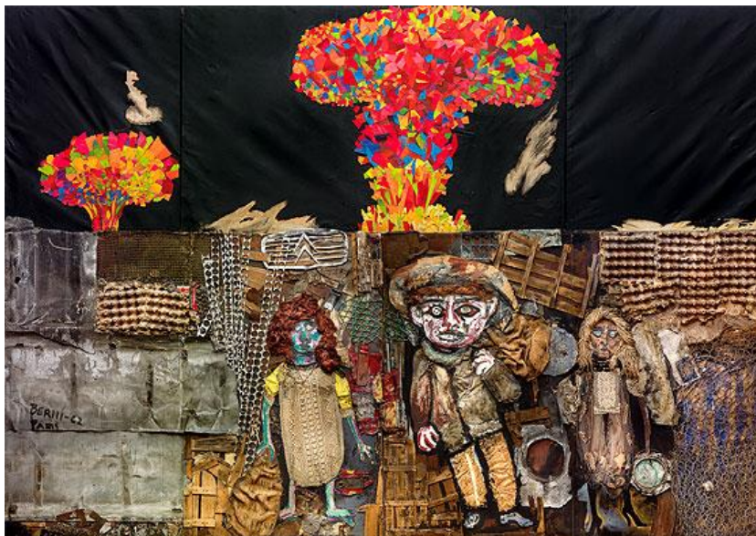
“El mundo prometido a Juanito Laguna” de Antonio Berni